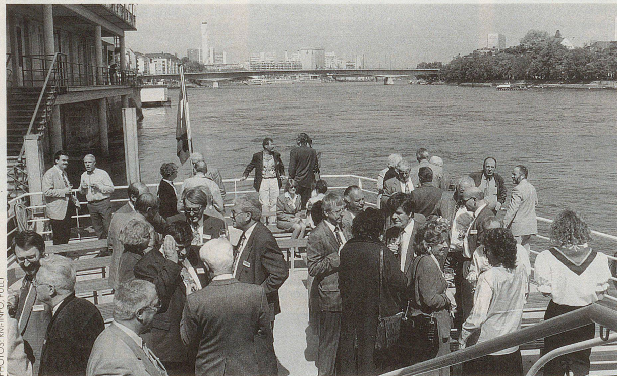
L'heure de l'apéritif pour les délégués.