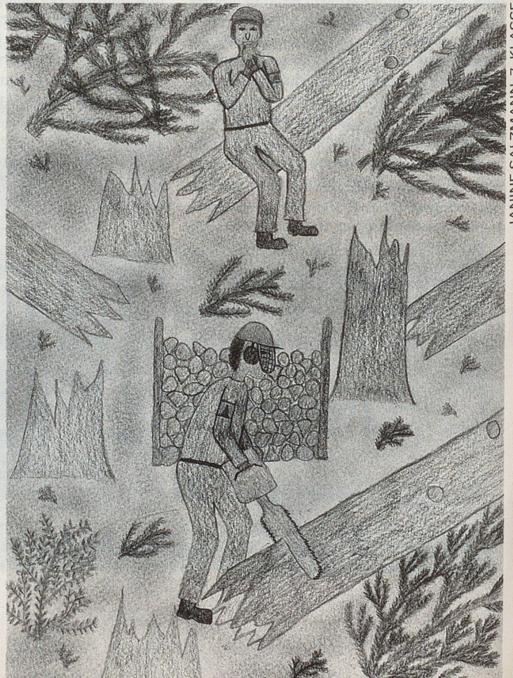
JANINE SALZMANN, 7. KLASSE