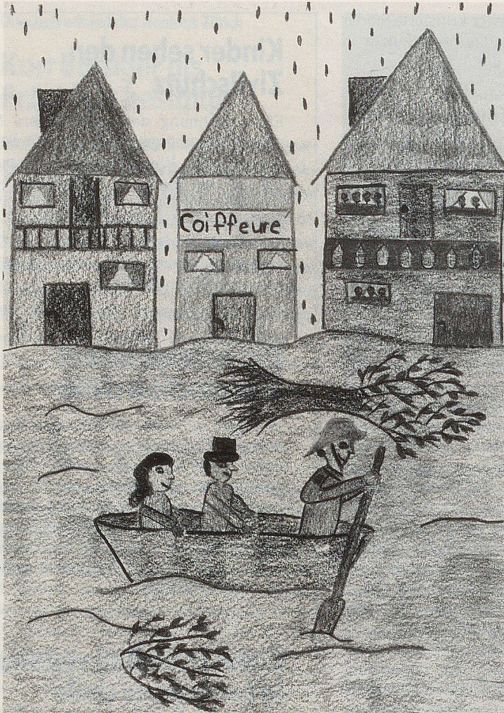
SANDRA STETTTLER, 5. KLASSE