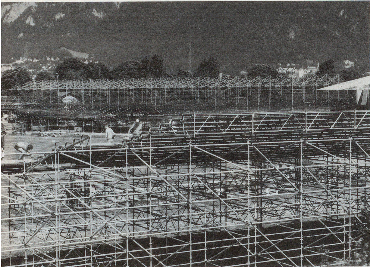
Beim Aufbau dieser riesigen Zuschauertribüne halfen 120 Zivilschützer tatkräftig mit.