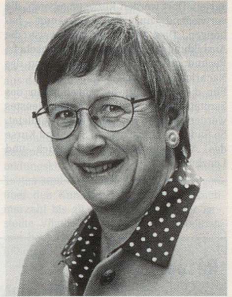
Regierungsrätin Stéphanie Mörikofer-Zweez.

Die 232 Gemeinden des Kantons Aargau sind in 99 Zivilschutzorganisationen zusammengefasst. Diese teilen sich in insgesamt 1015 Blöcke auf. Es sind ihnen 264 Rettungszüge zugeteilt. Die Sollbestände belaufen sich ab 1995 auf 29802 ZSO-Angehörige. Diese sind aufgeteilt in: Leitungen 1229, Stabsdienste 2496, Bevölkerungsschutzdienst 13796, Betreuungsdienst 111, Kulturgüterschutzdienst 129, Rettungsdienst 6686, Sanitätsdienst 3979, Logistische Dienste 1376.