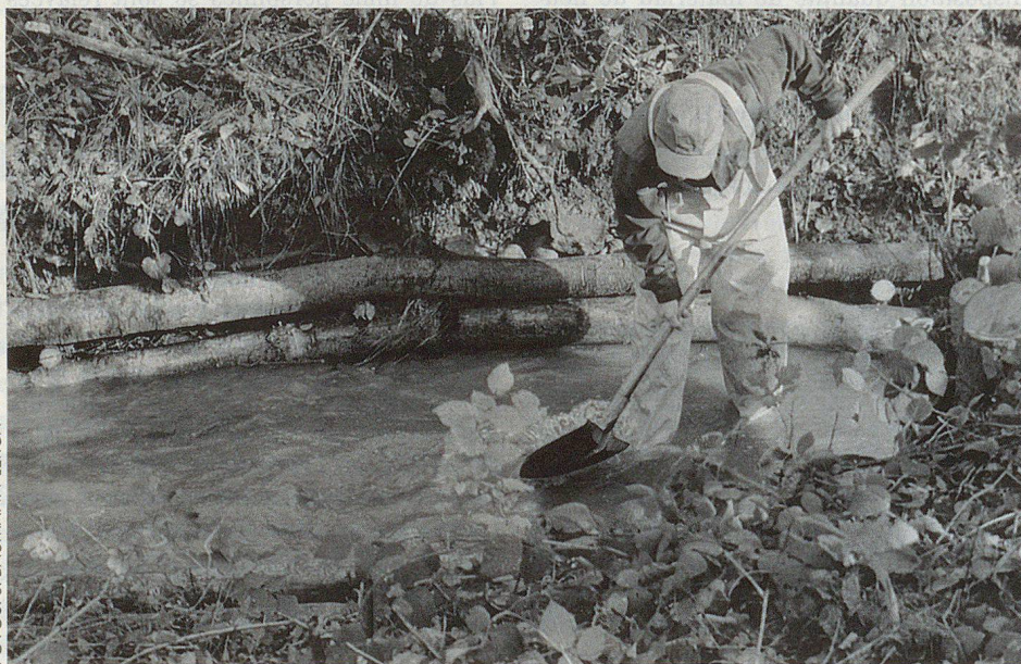
Ausgerodetes Ufergehölz wird teilweise für die Verbauungen der unterspülten Bachufer verwendet.