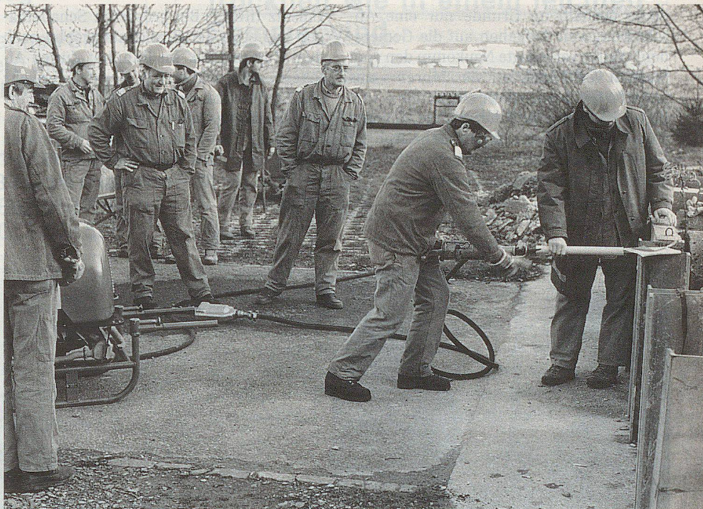
Die neuen Rettungspioniere der Zivilschutzorganisation Arth-Lauerz lernten bei der Gemeindeübung in Seewen den Umgang mit Kompressoren.