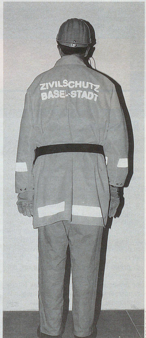
Orangefarbene persönliche Ausrüstung (vorne und hinten).