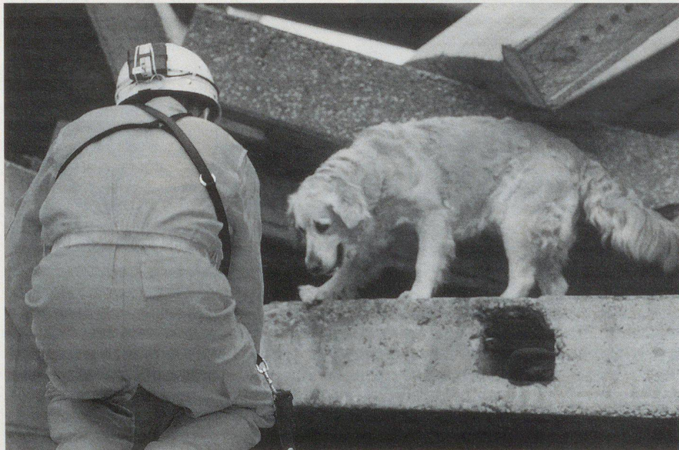
Katastrophenhunde suchen die Trümmer nach Verschütteten ab.

Um 13.20 Uhr ereignet sich der Absturz, und um 13.21 Uhr wird Alarm gegeben. Die Häuser zweier Strassenzüge sind vom Schadenereignis betroffen. Wie viele Menschen zu Schaden gekommen oder vermisst sind, stellt sich erst im weiteren Verlauf heraus. Vorerst gilt es zu handeln. Um 13.30 Uhr ist eine erste Polizeipatrouille auf dem Platz, nur fünf Minuten später auch die Katastrophen-Einsatzleitung mit ihrem Chef Richard Birchler. Teile der Feuerwehr Schötz mit einem Tanklöschfahrzeug und einem Pikettfahrzeug treffen ein. Nebst der Löschmannschaft kommt auch der Atemschutz zum Einsatz. Mittels Schlauchleitungen und Schnellangriff werden die gefährlichsten Brände gelöscht. Kleineren Bränden wird mit der Eimer-spritze zu Leibe gerückt.