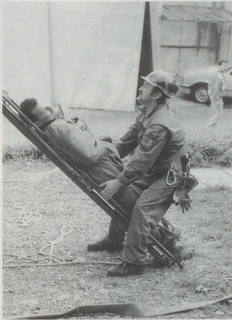
Zivilschutz im Rettungseinsatz.