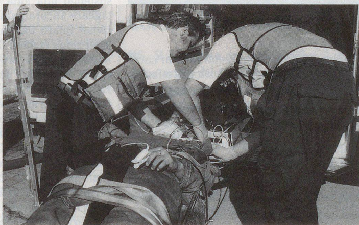
Le groupe de sauvetage de l'armée vient à la rescousse...