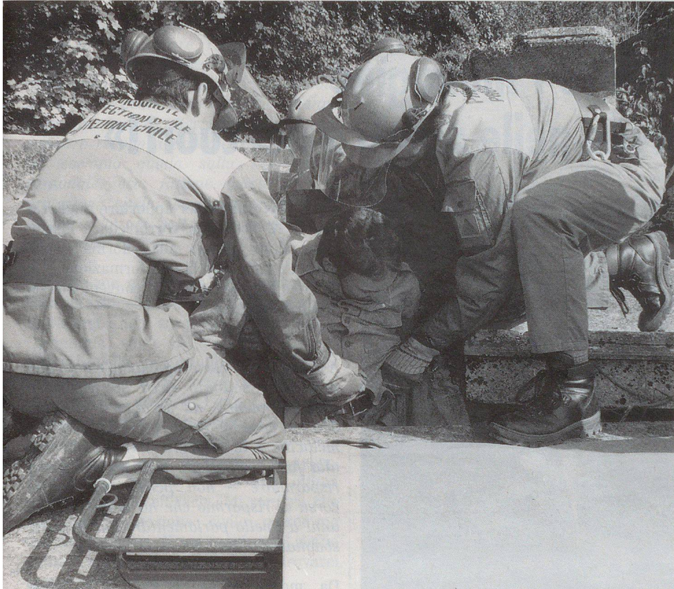
Les pionniers de la PCi le dégagent...