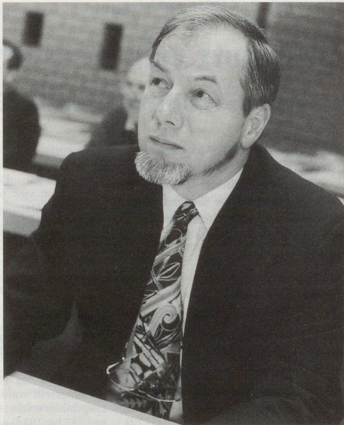
Peter Bolinger, Vorsteher des kantonalen Amtes für Zivilschutz.

de an die Standortgemeinden überführt. Zur Vorbereitung eines schnellen Einsatzes im Katastrophenfall werden Teile des Einsatzmaterials abfahrbereit gelagert. Die Übergabe des Zivilschutz-Brand-schutzmaterials an die Feuerwehren ist abgeschlossen.