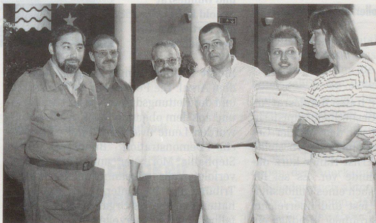
Gli uomini della Pci di Zofingen, responsabili della cucina.