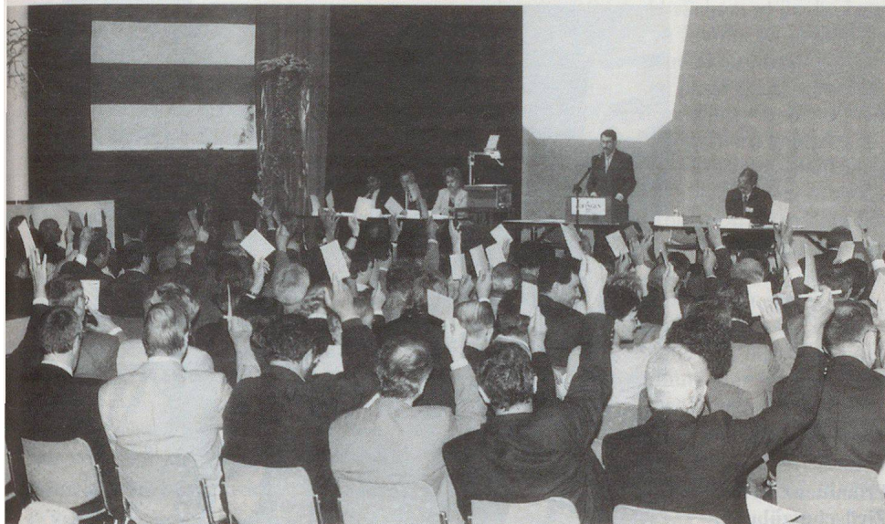
L'assemblea sta approvando il budget 1996.