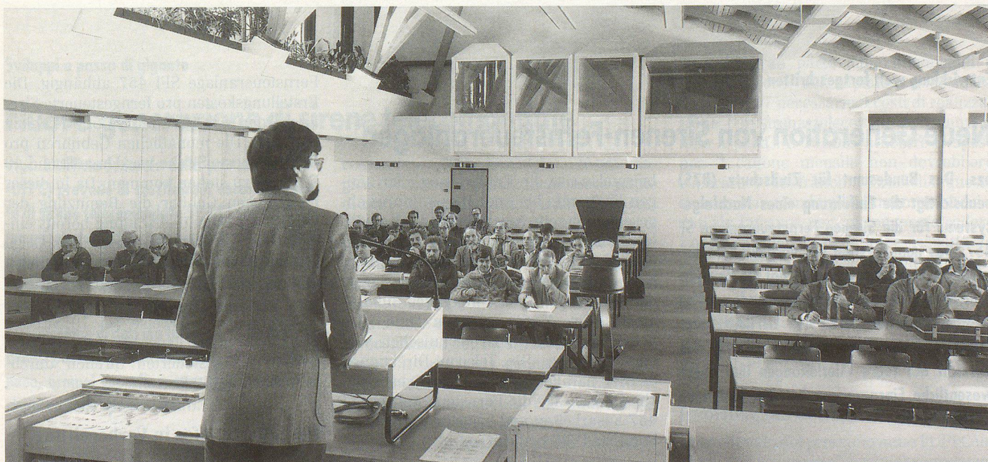
Die Abteilung Ausbildung verfügt über modernste Infrastruktur und Klassenzimmer oder Plenarsäle. In der Ausbildung steckt die Zukunft des Zivilschutzes.

Abbiamo la fortuna di esercitare una professione affascinante e variata che non lascia spazio per annoiarsi. Incontriamo continuamente gente nuova di diversa provenienza e con un bagaglio culturale molto vario. L'opportunità di poter dare a queste persone qualcosa che le accompagnerà per tutta la vita e la consapevolezza di fare qualcosa di utile sono per noi la migliore motivazione a continuare sulla nostra strada. ▀