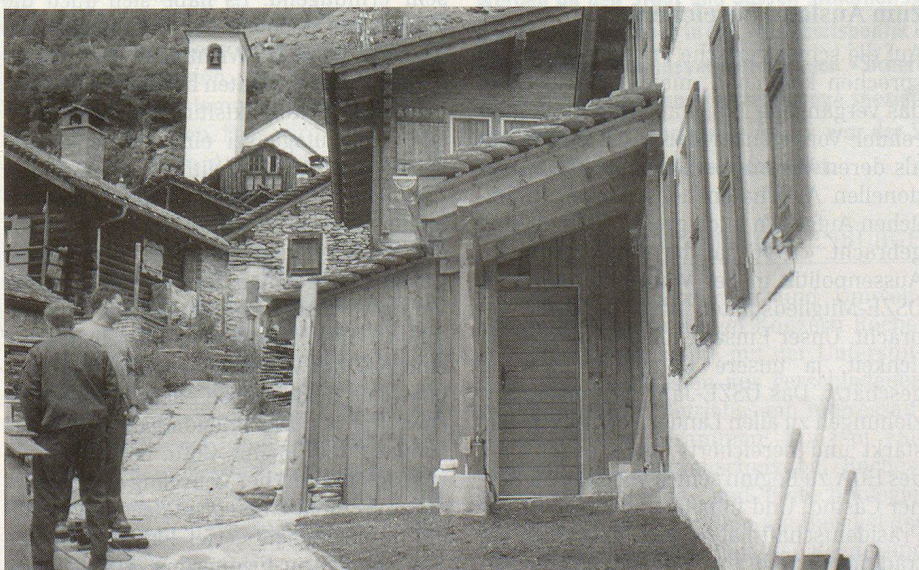
Der Anbau an das Schulhaus von Landarenca.