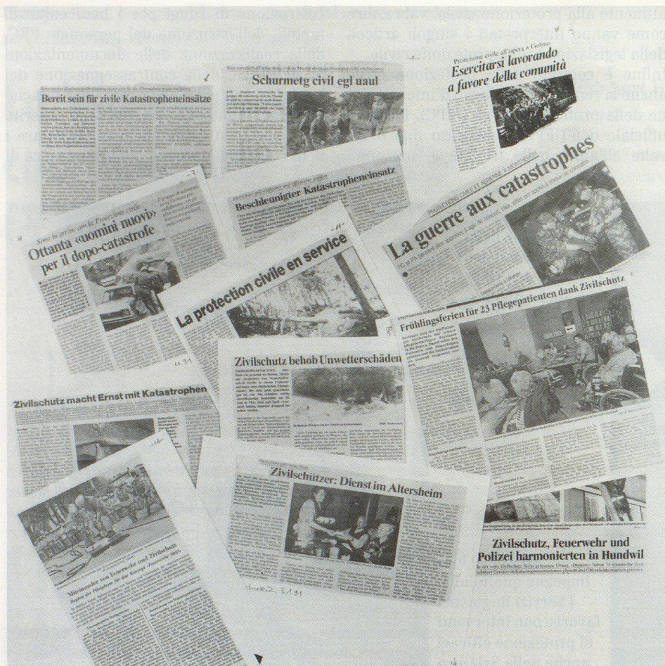
La Sezione informazione pubblica regolarmente una rivista stampa.

tonali responsabili della protezione civile, nonché con i comuni risp. le organizzazioni di protezione civile (OPC), le associazioni di categoria come pure con il servizio informazioni del dipartimento. Si opera una distinzione tra informazione interna e informazione esterna. Le attività legate all'informazione sono regolamentate in un apposito piano concordato con i cantoni, il quale viene periodicamente aggiornato in funzione delle necessità del caso. La sezione informazione coadiuva l'istruzione degli addetti all'informazione delle OPC elaborando i pertinenti sussidi didattici nonché mediante la pubblicazione di un «Manuale per le relazioni pubbliche nella protezione civile». Anche l'imminente presentazione della protezione civile svizzera su Internet è opera della sezione. I collaboratori sono pure responsabili di procurare e concedere in prestito il materiale d'esposizione e consigliano gli enti interessati ad allestire uno stand della protezione civile in occasione di fiere o esposizioni oppure di organizzare una manifestazione d'altro genere sul tema.