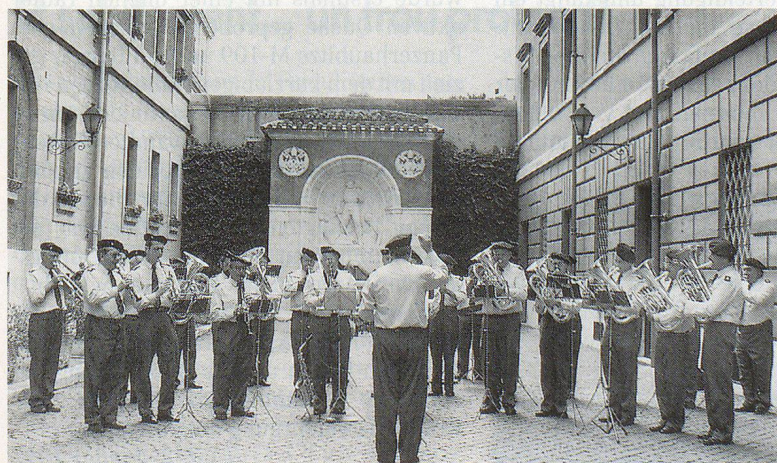
Das Spiel der Thuner Zivilschutzorganisation anlässlich des Konzertes im Hofe der päpstlichen Schweizergarde im Vatikan.

Grossen Applaus erntete das Thuner Zivil-