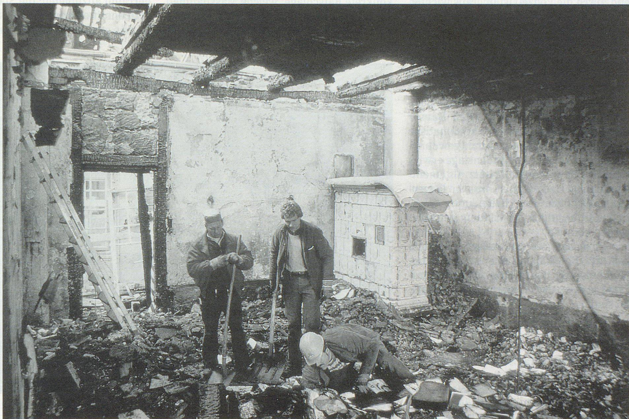
Ausgebrannter Salon an der Junkerngasse 37.

Im folgenden soll versucht werden, die Erfahrungen und Lehren, welche sich aus