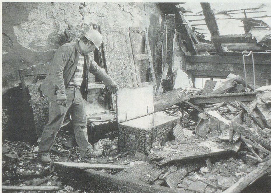
Von den herabgefallenen Trümmern befreite Archivkiste.

Der Autor ist Denkmalpfleger der Stadt Bern.