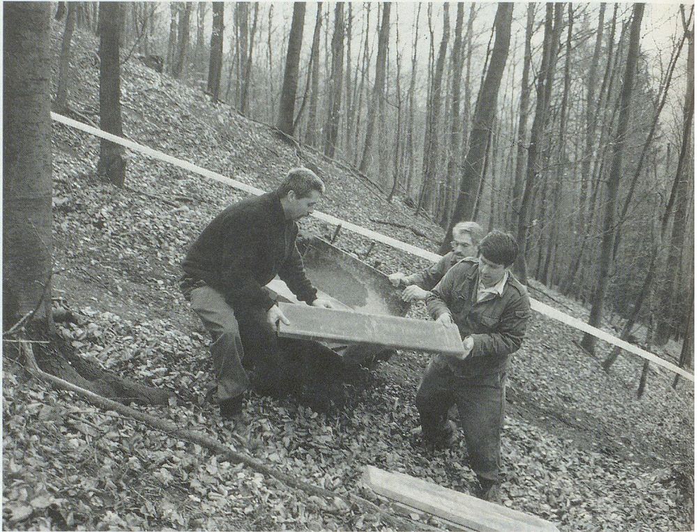
Die Arbeit im steilen Gelände war zwar streng, aber faszinierend.