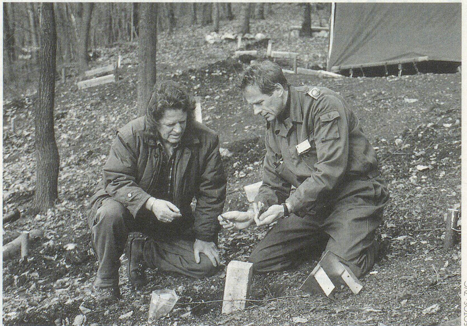
Während den Arbeiten wurden immer wieder urzeitliche Gegenstände entdeckt.

trieben, sich Schweine, Schafe und Ziegen hielten und sich von Fleisch, Milch und Brot ernährten.