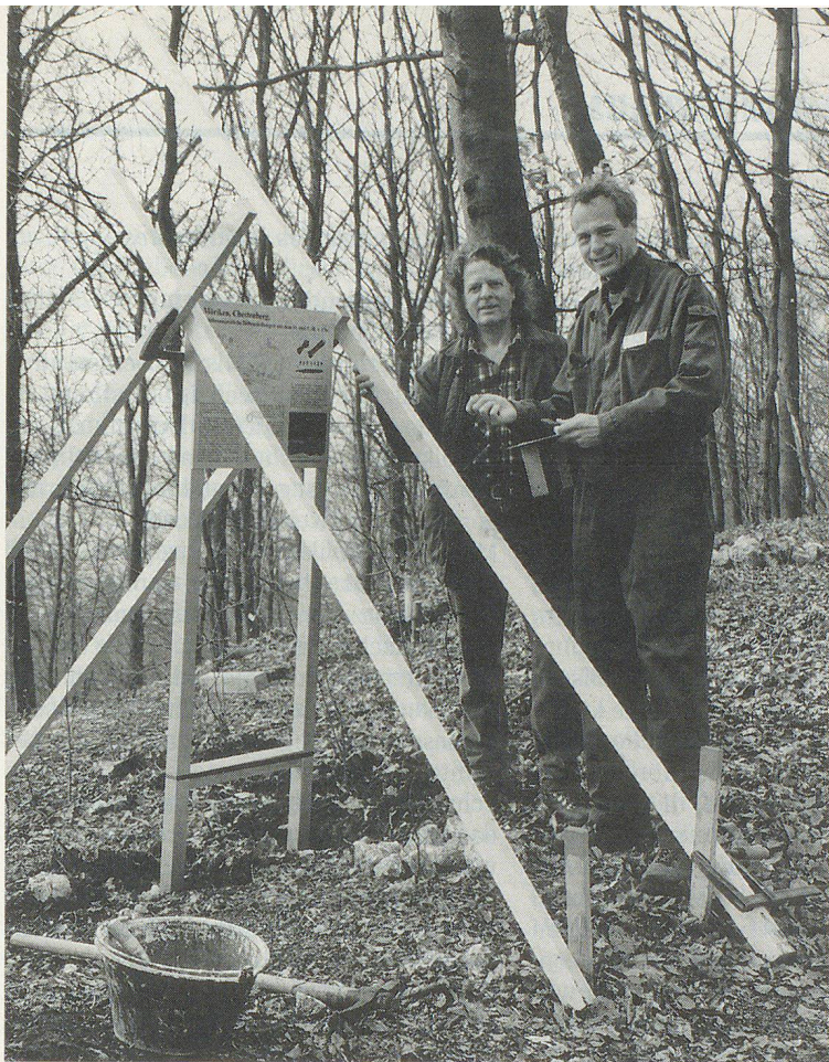
Die Orientierungstafel vermittelt die erforderliche Information.

in Basel. Zahlreiche Fundgegenstände aus den Ausgrabungen sind im Museum Burg- halde Lenzburg zu besichtigen und wurden dem Zivilschutz zu Ausstellungszwecken leihweise vom Konservator zur Verfügung gestellt.