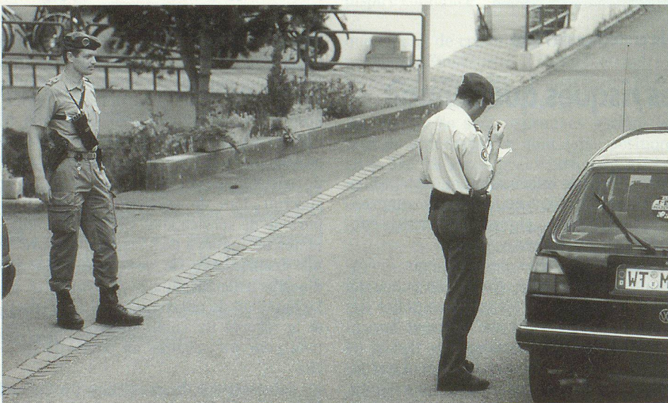
La collaboration entre les gardes-frontière et les gardes-fortifications fonctionne harmonieusement.

Vues à grande échelle, les interventions de la troupe visant à soutenir les autorités civiles pour le service de l'ordre ainsi que l'engagement de la troupe pour la protection des personnes et des choses peuvent être comptées parmi les tâches policières de l'armée. La troupe peut être engagée de manière comparable pour la protection d'ouvrages, la protection de personnes, les escortes et pour d'autres tâches encore. L'ordonnance du 1 er octobre 1997 règle aussi ces interventions subsidiaires au profit de la sécurité. Selon une information du département DDPS, ces interventions subsidiaires au profit de la sécurité s'alignent dans toute une série de décisions axées sur l'avenir, dans la procédure du développement futur de l'armée suisse. Durant l'année écoulée, l'armée a déjà été mise fortement à contribution en rapport avec la protection des bases d'existence en général: outre le service d'assistance au congrès sionniste mondial à Bâle, il a fallu maîtriser les catastrophes de Miso, du lac Noir et de Sachseln. Aujourd'hui, l'armée est très demandée pour des interventions de tous genres pour la sécurité. ▀