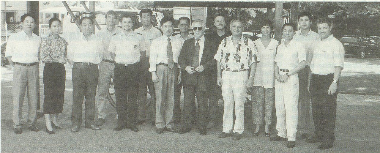
La délégation chinoise, en compagnie de collaborateurs de l'OFPC, s'est rendue notamment à Genève, où elle a pu prendre connaissance des modalités de la collaboration entre la protection civile et les sapeurs-pompiers.

Des responsables chinois s'informent sur la protection civile suisse