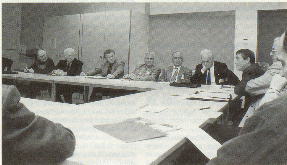
Le groupe latin phosphore.

Le plus gênant, ce sont toutes ces appellations se terminant par un 200X, qui ont une fâcheuse tendance, pour les acteurs du terrain, de donner à penser qu'il manque une vision globale. Que tout flotte dans un brouillard peu rassurant. Sur le fond pourtant, ce fut une bonne journée; elle aura eu le mérite de montrer la complexité des problèmes que pose la radicalisation de ce que l'on appelle «les menaces». De plus, relever un tel défi n'est pas favorisé par la position d'isolement de notre pays. Finalement, il était bien plus confortable pour chacun, lorsque l'ennemi venait de l'Est. ▀