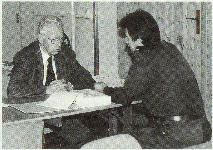
Sorgfältige Einzelabklärungen mit den Hausbesitzern: Die Zivilschutzaktion fand ein grosses Interesse.

Die gute Zusammenarbeit mit der Firma Heuscher & Partner und die Basierung auf der vorhandenen Software dieser Firma hat die administrativen Arbeiten der Zivilschutzstelle stark vereinfacht und entlastet. ▲