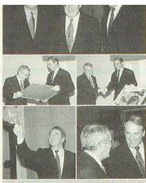
Der Zivilschutz geht ins Internet La protection civile maintenant sur Internet! Le profession civile adesso su Internet!