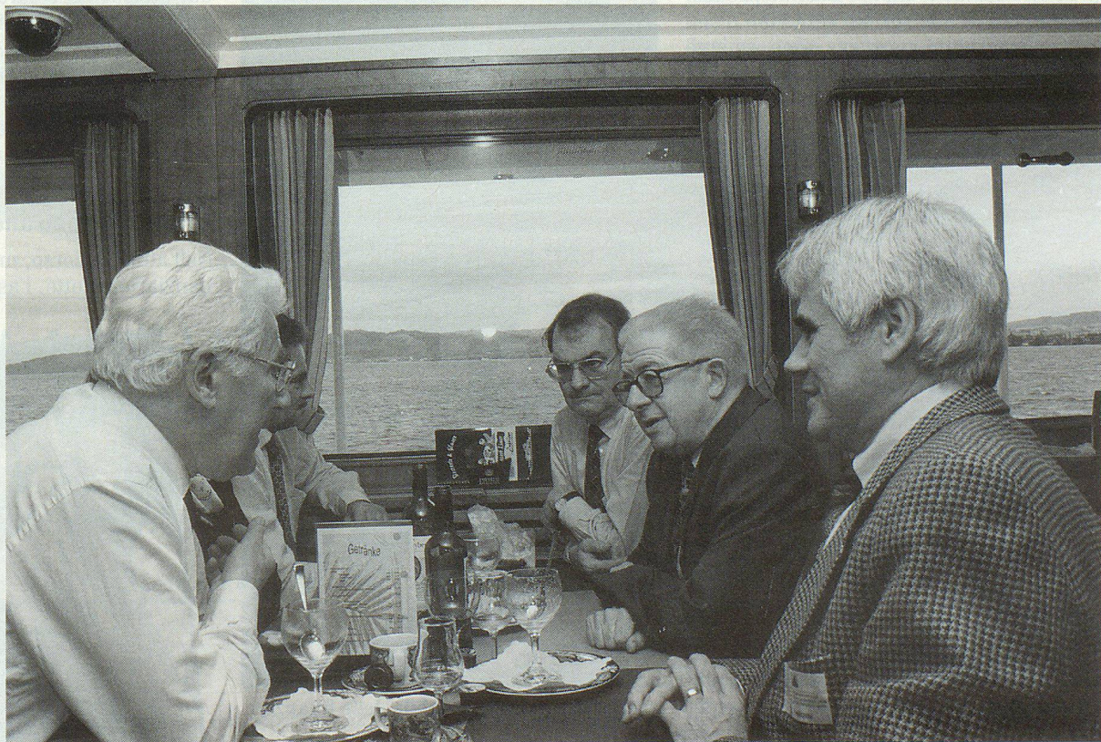
Discussion animée entre «Romands».

Le conseiller aux Etats Thomas Onken a traité de ce thème qui montre, à l'évidence, que l'étroitesse d'un pays ou d'une région n'a pas forcément de rapport direct avec l'ampleur des problèmes que ceux-ci doivent aborder. Pour la petite histoire, cette Euregio reliée par le lac touche trois pays – l'Allemagne, l'Autriche et la Suisse, sans oublier le Liechtenstein – et abrite quelque 2 millions d'habitants. Sans que l'on puisse y voir une structure identique, il n'en reste pas moins qu'il y a certaines concordances, comme par exemple une même langue pour trois pays. Ce rapprochement a pourtant subi un revers de taille lors de la votation du 6 décembre 1992. D'un seul coup, la frontière a pris sa vraie dimension en nous isolant de voisins «naturels». Pourtant, cette cohabitation, même si elle est parfois plus complexe politiquement parlant, est demeurée vivante. Grâce aux efforts d'hommes motivés, situés de part et d'autre de cette frontière naturelle que représente le lac, la coopération s'organise. Issus de longues traditions, chacun peut attendre des secours de l'autre et cette Euregio encore jeune est promise à un grand développement. ▀