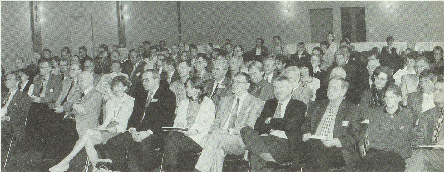
Cent dix délégués et hôtes présents à Romanshorn.