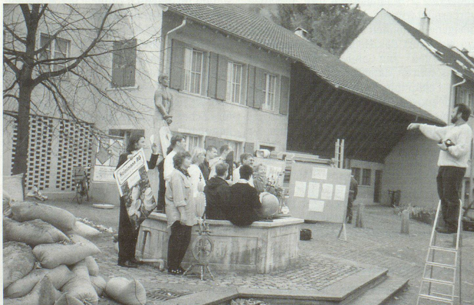
Bevor der erste Sandsack gesetzt wird, ist eine Orientierung über das Vorhaben angesagt.