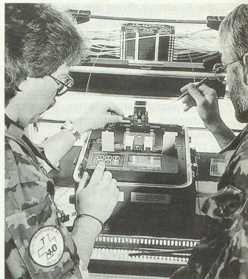
Gli specialisti della br tc 40 al lavoro.

On trouve aussi des organes Télécom dans les corps de troupe. Les quelque 180 officiers et sous-officiers qui sont incorporés dans les états-majors et dans les unités assurent que les installations de Swisscom SA puissent être engagées dans l'intérêt de la défense générale. Ils forment un pont entre la brigade Télécom 40 (l'exploitante), la Swisscom SA (la propriétaire) et les organes de l'armée (l'utilisateur). Ils ont pour mission de conseiller les commandants et les chefs des services de transmissions; ils doivent aussi instruire les services de transmission dans la technique de raccordement. ▀