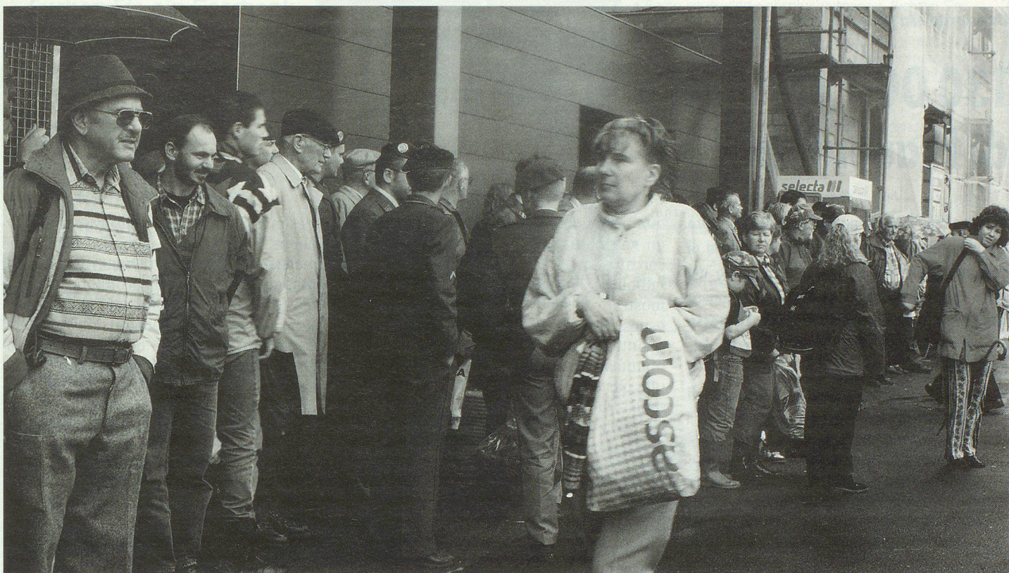
130 000 visiteuses et visiteurs à la journée de l'armée 1998 et presque tous étaient enchantés.

spectre qu'offre l'armée suisse. Les points d'attraction principaux furent les démonstrations de la brigade de chars, celles des moyens de transports aériens et celles de l'aviation. Dans onze arènes, on montrait les domaines d'intervention des armes les plus diverses et les expositions ont traité dans le détail de 14 sujets. Enfin, un programme annexe avec des films et des jeux militaires dans toutes les cantines, apportèrent avec d'autres attractions, beaucoup de variété.