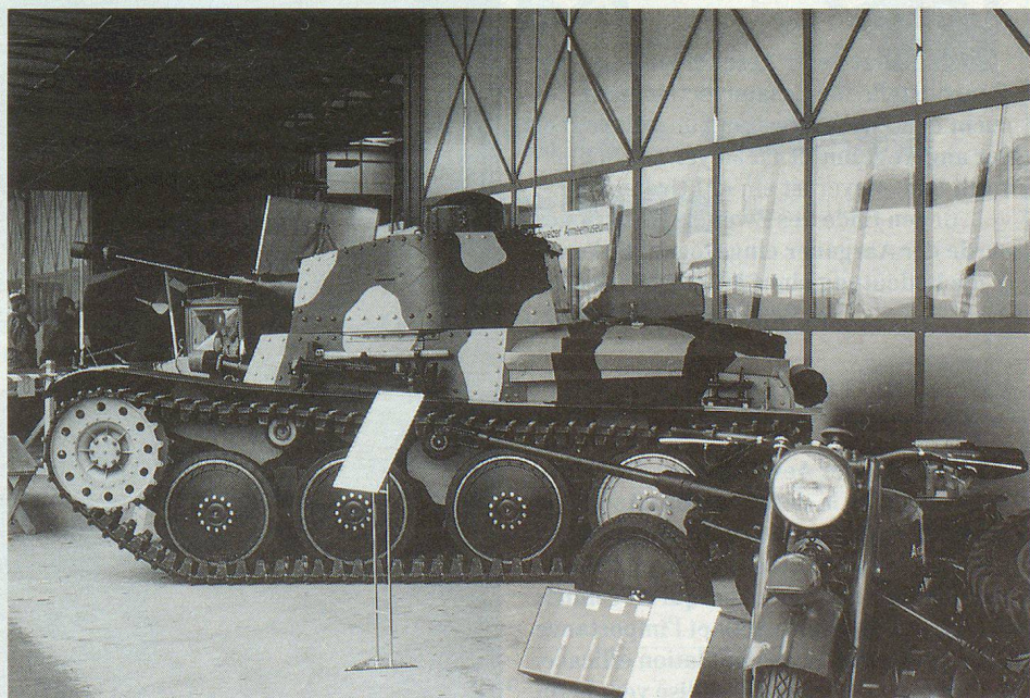
L'armée suisse d'il y a 50 ans: un char Praga 39 du Musée suisse de l'armée.