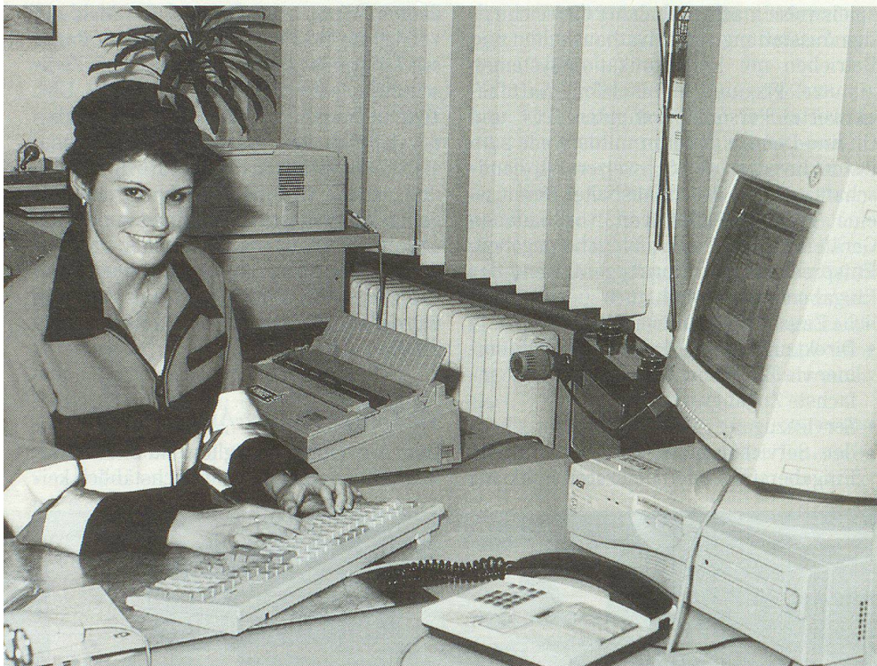
Kurze und verdiente Verschnaufpause in der ZSO-Alarmierungsstelle.

nikation gewinnt zunehmend an Bedeutung; zum Beispiel die Rufweiterleitung von Sprachspeichersystemen (Notifikation) und bei Telematik-Anwendungen die Alarmgeber. Denn trotz Mobilität ist man sofort informiert, wenn auf dem Anrufbeantworter zu Hause oder den Sprachspeichersystemen Combox (Natel) oder Messagebox (Telefon) eine Sprachmeldung eingegangen ist. Der Pager wird so zum «verlängerten Arm» von anderen Kommunikationssystemen.