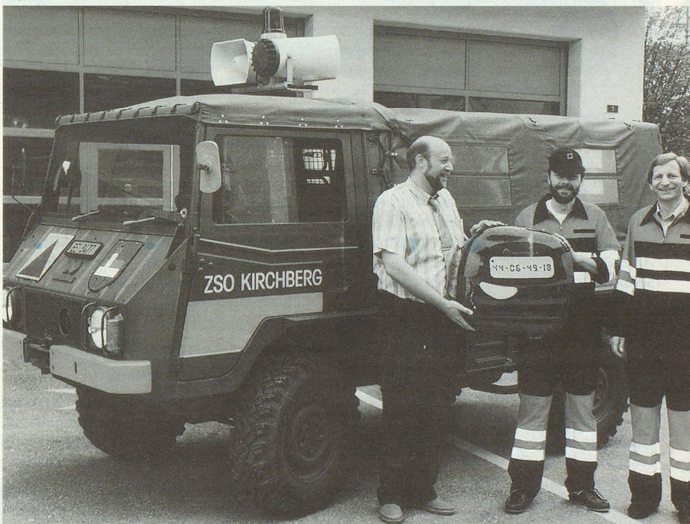
Frohe Gesichter bei der symbolischen Pager-Übergabe durch die Lieferfirma.

Den Anwendungsmöglichkeiten der Einwegkommunikation sind buchstäblich kei-