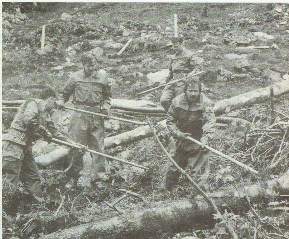
Bachbette ausräumen, Schutt und Geröll von den Alpweiden entfernen, Fallholz zerkleinern und auf die Wege transportieren und Neuzäunungen erstellen, stand auf dem Arbeitsprogramm der Rothenburger Zivilschützer.

Zivilschützer aus den Kantonen Nidwalden, Zug, Aargau und Luzern kräftig Hand an, und für den Herbst haben sich Zürcher Zivilschützer angemeldet. «Jeder geräumte Quadratmeter ist wichtig», betonte Degelo. Seine bisherigen Erfahrungen: Mit dem Zivilschutz ist es einfach, zu organisieren und zu arbeiten, und er ist sehr leistungsfähig.