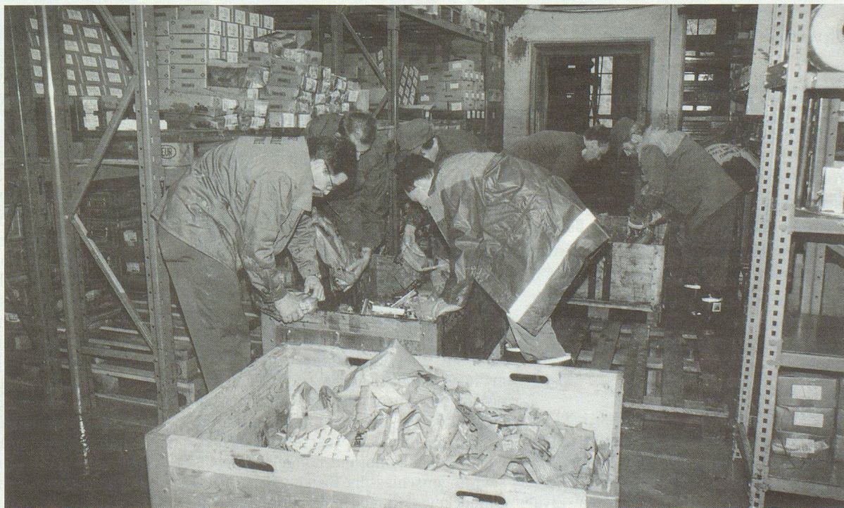
Wertvolles Material wird in Sicherheit gebracht, denn eine neue Flutwelle ist angekündigt.