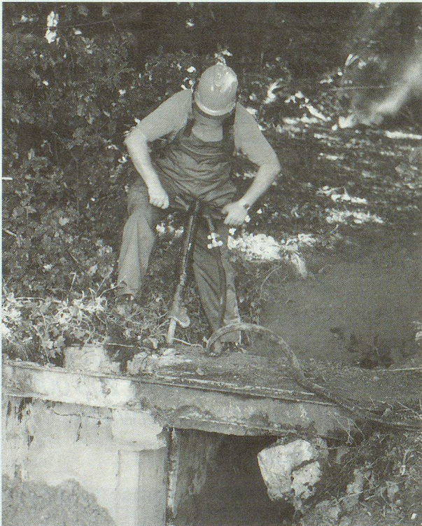
Dem alten Schiessstand wird zu Leibe gerückt.

Ins Bild aktueller Organisation des Zivilschutzes passt auch das Betreuungs-Pilotprojekt im Altersheim Lüterswil. Die Pensionäre reagierten sehr positiv. Es ist deshalb ein vermehrter Einsatz von Zivilschützern im Altersheim vorgesehen. Im Jahr 2000 wird das Lüterswiler Altersheim zudem im Rahmen einer kombinierten Rettungs- und Betreuungsübung, zusammen mit der Feuerwehr, im Mittelpunkt stehen. ■