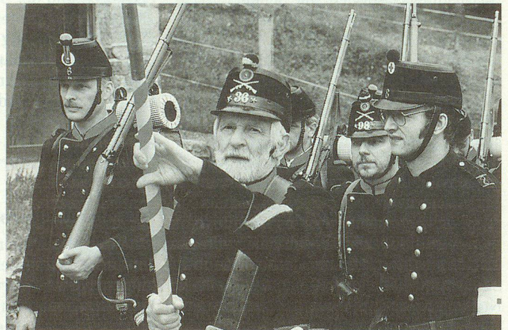
Junge Soldaten in der Blüte des Lebens und ergraute Männer in historischer Uniform.