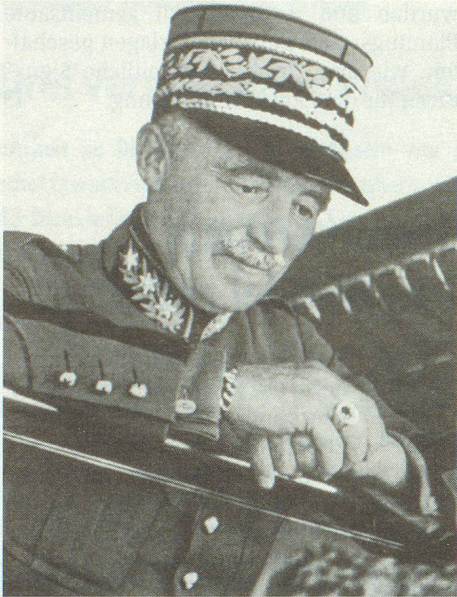
Unser General Henri Guisan. Auch heute noch ein Vorbild für Standhaftigkeit, Mut und Menschlichkeit.

Vor 59 Jahren, am 25. Juli, verkündete General Henri Guisan den totalen Widerstand