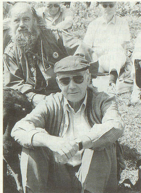
Erkennt? Der frühere Vorsteher des Amtes für Zivilschutz des Kantons Bern.