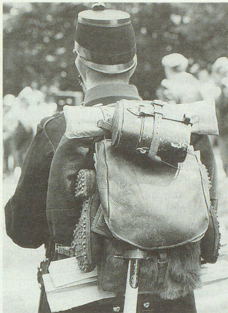
Mit Sack und Pack und guten Mutes.