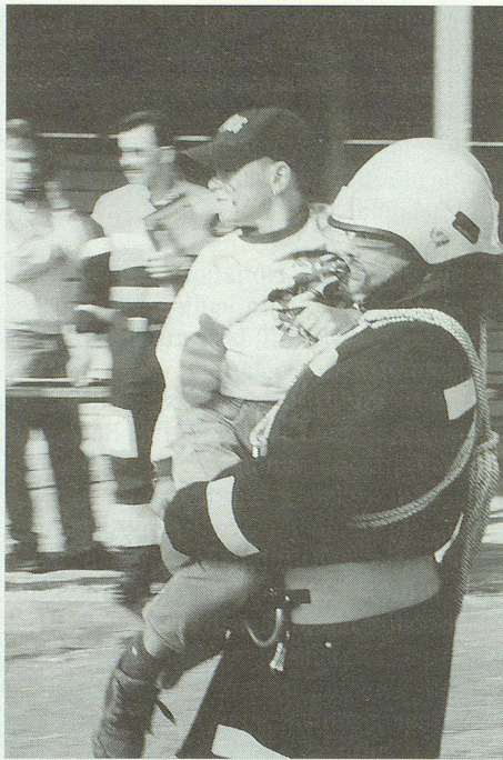
Fort aus der Gefahrenzone! Die Feuerwehr achtete nicht auf das «Holprinzip».

Interessant ist die Beurteilung der Spitex, die erstmals an einer solchen Übung mitwirkte. Von allen Einsatzkräften wurde zwar der Einsatz des Spitexpersonals sehr begrüsst und die Partnerschaft in besonderen Lagen als sinnvoll angesehen. Die unterschiedlichen Qualifikationen kamen mit der Kennzeichnung «Spitex» jedoch nicht zum Tragen. Diplomierte Krankenschwestern waren unterfordert und Laienhelfer überfordert. Sehr geschätzt und kaum mehr in Abrede gestellt wurde auch der Einsatz der Psychiater und Seelsorger. Allerdings besteht in diesem Bereich noch ein erheblicher Informationsbedarf, so zum Beispiel hinsichtlich der Möglichkeit zur Nachbetreuung (Debriefing) oder des Bestehens eines Sorgentelefon. «Weiter ausbauen und besser bekannt machen», lautete die Schlussfolgerung. rei.