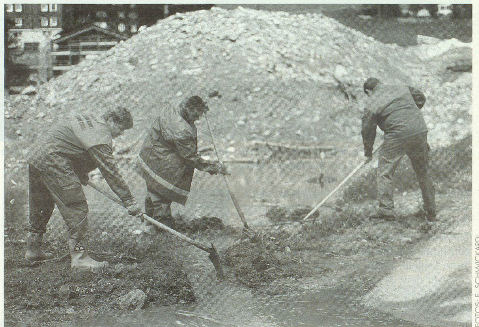
Die Windischer Zivilschützer bei der Arbeit auf dem Lawinenkegel.

Die Lawinenniedergänge hinterliessen verheerende Spuren. Ein mehrere hundert Meter breiter und meterhoher Schnee- und Schuttkegel, durchmischt mit Geröll, Baumstämmen oder zwischendurch mal mit einem Autowrack türmte sich auf. Die weissen Massen hatten alles mitgerissen: mehrere Häuser, Autos, Strassenschilder. Sieben Lawinen waren alle aus dem gleichen Seitental herabgedonnert. «Ich bin froh, dass das Dorf noch steht», sagte ein Geschiner Bergbauer.