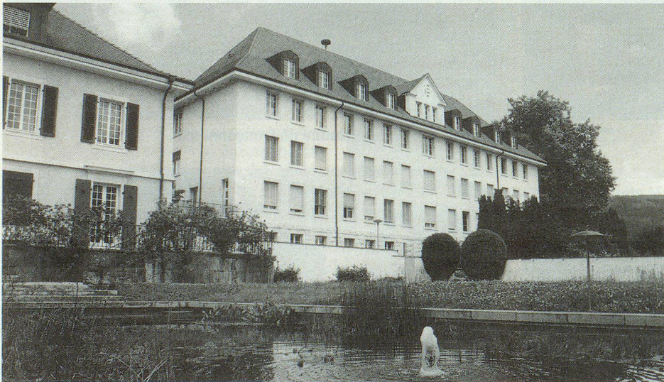
L'Institut agricole jurassien à Courtemelon.

Le plus étonnant, c'est qu'il ne s'agit pas d'une série de galeries vides; non. Le fort est entièrement aménagé, de la batterie de cuisine à l'infirmerie, en passant par les canons et tout le système de ventilation. Bref, tel qu'il a été laissé lorsque l'armée l'a cédé. Étonnant pour certains, désuet et inutile pour d'autres, il ne laisse pas indifférent. Il vaut largement le détour pour ceux qui s'intéressent à l'histoire de notre pays; pour les autres aussi. ▢