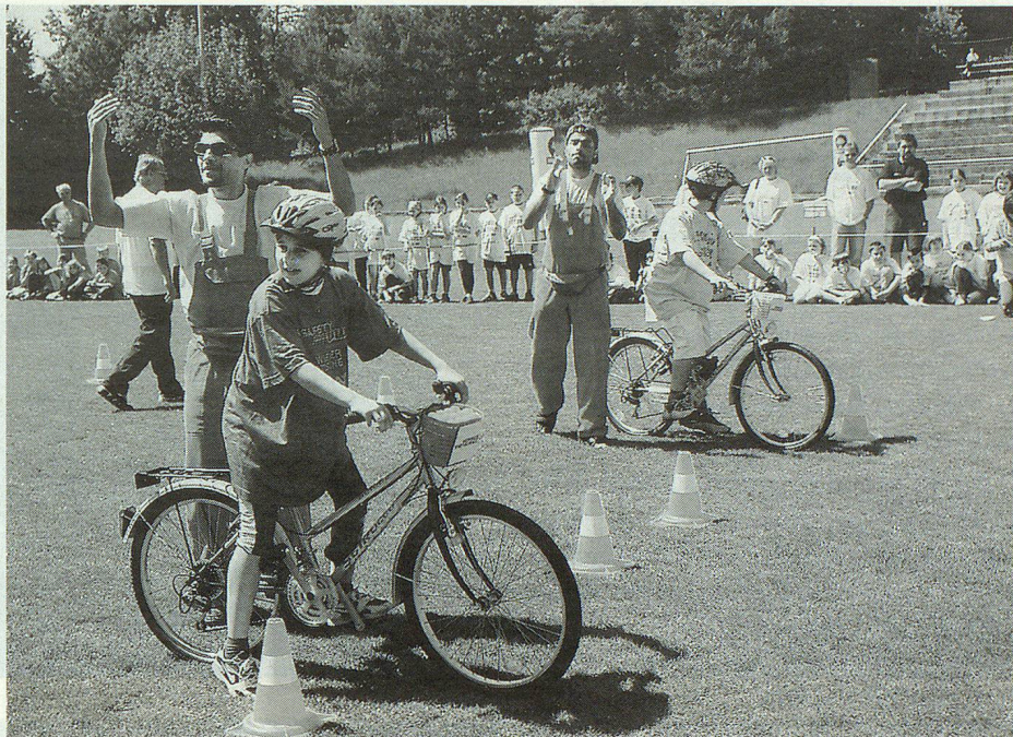
Superstimmung herrschte vom Start bis ins Ziel.