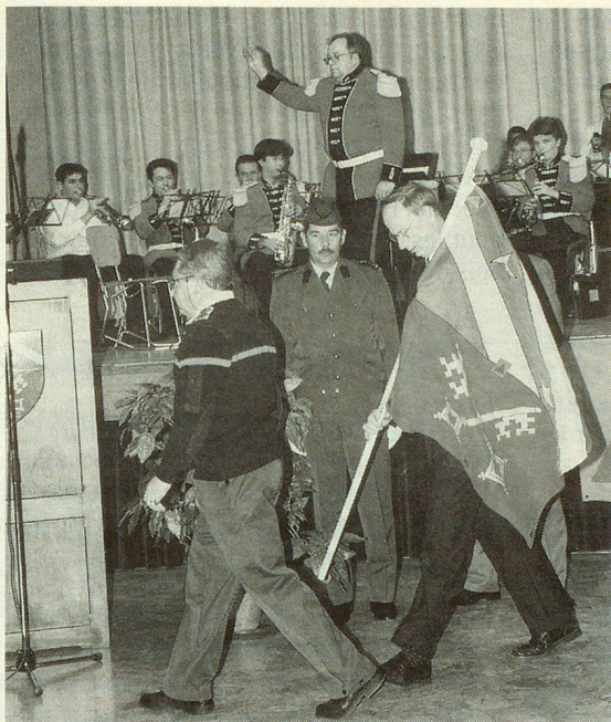
La PCI de Lancy est «démobilisée...»