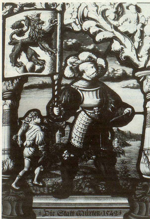
Wappenscheibe der Stadt Murten von 1542.

Und vieles ist noch zu tun Eines der dringendsten Probleme im KGS Murten ist das Fehlen von KGS-Schutzräumen. Nur schon die 150jährige Sammlung