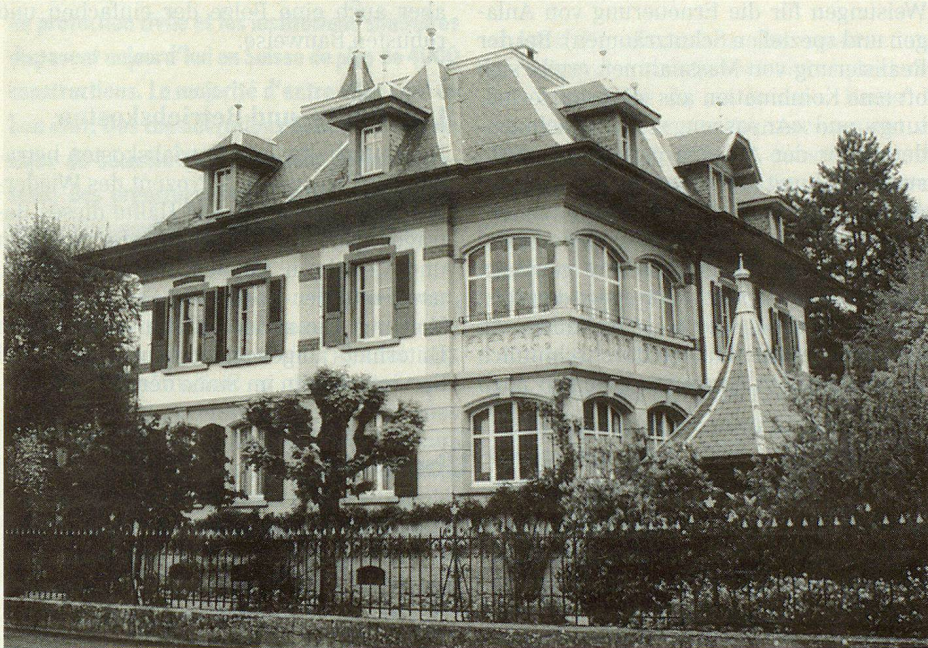
Die Villa Bahnhofstrasse 5 in Murten (C-Objekt).

Die Angaben und Fotos wurden in verdankenswerter Weise von Martin Bula, DC KGS Stv, zur Verfügung gestellt.