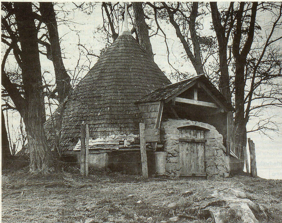
Der Eisspeicher in Greng – ein C-Objekt.