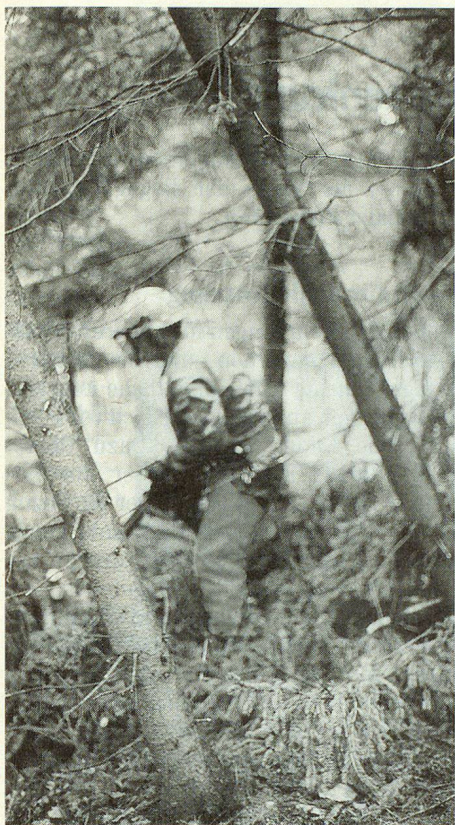
Ganz ungefährlich ist in diesem Chaos der Räumeeinsatz nicht.

gen eine Arbeitsleistung für die Allgemeinheit und vor allem für die zum Teil schwer betroffenen Bauern. Es tut auch gut, wieder einmal die Natur zu spüren und ihr Wirken zu erleben.»