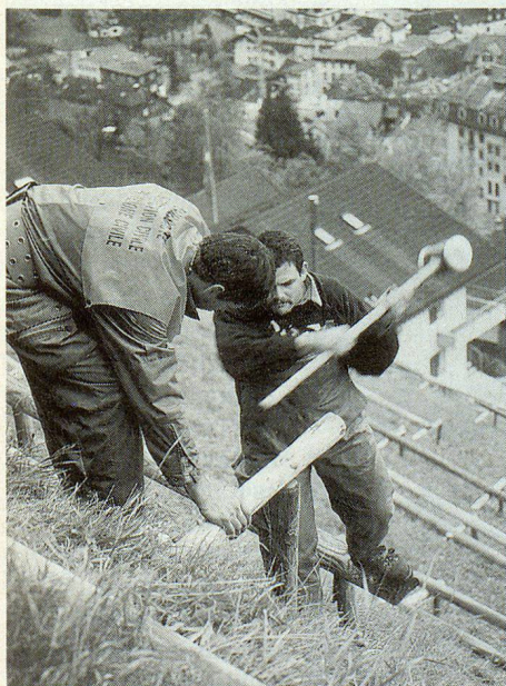
Solide Sicherungen im steilen Hanggebiet oberhalb des Dorfes.