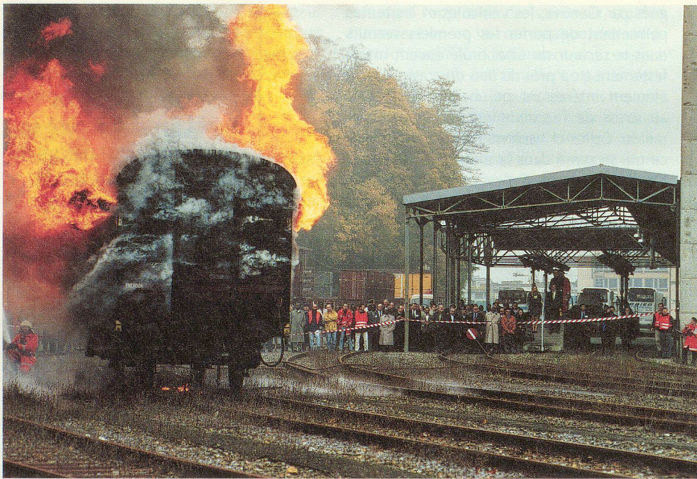
Le wagon s'embrase...