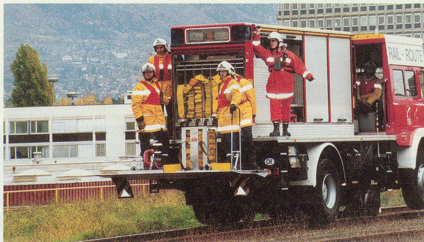
Le véhicule rail-route du SIS.

Les différentes sessions et démonstrations se sont déroulées sur deux jours. Les idées-forces, pour tous ces pays, consistaient à trouver des réponses cohérentes face à des catastrophes qui ont toujours plus d'incidences sur la vie des hommes. Dans ce domaine, quel rôle peut jouer le phénomène de la mondialisation? Est-ce une chance de renforcement de la coopération internationale? Comme chacun le sait, il appartient aux Etats d'offrir aide, assistance et protection à la population. Dans ce domaine, les structures nationales de protection civile contribuent-elles au développement de la société? Enfin, pour beaucoup d'Etats, le développement des capacités des structures nationales de PCI est un impératif urgent. Mais comment mobiliser les ressources au sein de la communauté internationale?