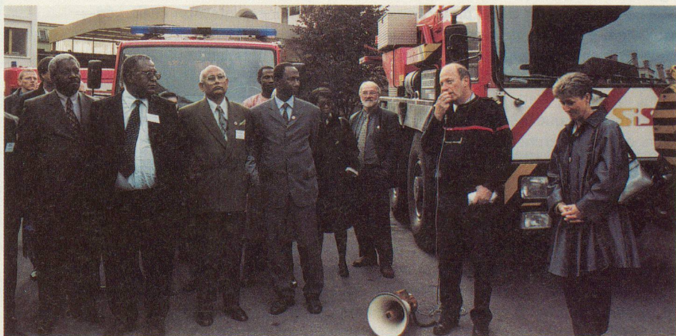
Visite de la caserne principale du SIS.

Durant ces deux jours, les participants ont encore visité le SIS de Genève, complété par un exercice à la gare de la Praille, qui a mis en œuvre un véhicule spécialisé rail-route des sapeurs-pompiers, ainsi qu'un des trains d'extinction et de sauvetage des CFF. Ils ont également eu l'occasion de visiter l'Hôpital cantonal et de prendre connaissance du plan catastrophe genevois (ISIS).