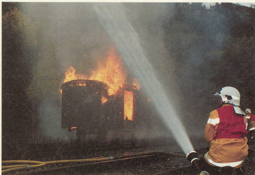
Les hommes du SIS viennent en renfort...