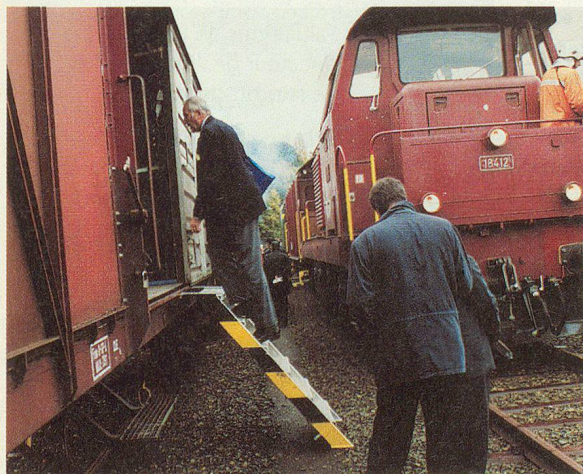
Visite du train d'extinction des CFF.