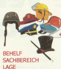
BEHELF SACHBEREICH LAGE

Wenn im Rahmen einer besonderen bzw. ausserordentlichen Lage beispielsweise in einer Einsatzleitung vor Ort Polizei, Feuerwehr und allenfalls weitere Einsatzkräfte parallel Einsatzjournale und Lagedarstellungen führen, ärgern sich jeweils diejenigen, welche mit dem Fortschreiten des Geschehens plötzlich mit Widersprüchen im Sachbereich Lage konfrontiert sind.