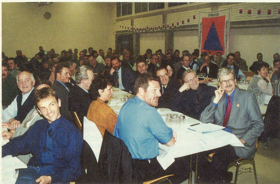
Die Versammlung in Lüterswil war gut besucht, und auch Regierung, Verwaltung, Parlament und viele Gemeinden waren vertreten.

ren im Nebenamt kaum mehr zu führen. Modell 2 umfasst 16 Gross-ZSO. Es berücksichtigt noch vermehrt Ergebnisse aus Gesprächen, welche um die Visionen herum geführt wurden.