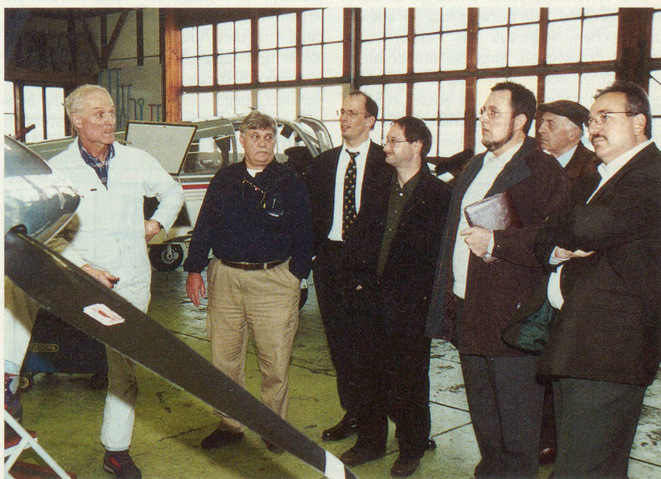
Die Solothurner Zivilschutz-Instruktoren planen noch immer keine eigene «Luftwaffe», dafür liessen sie sich Qualitätssicherungsmassnahmen erläutern.