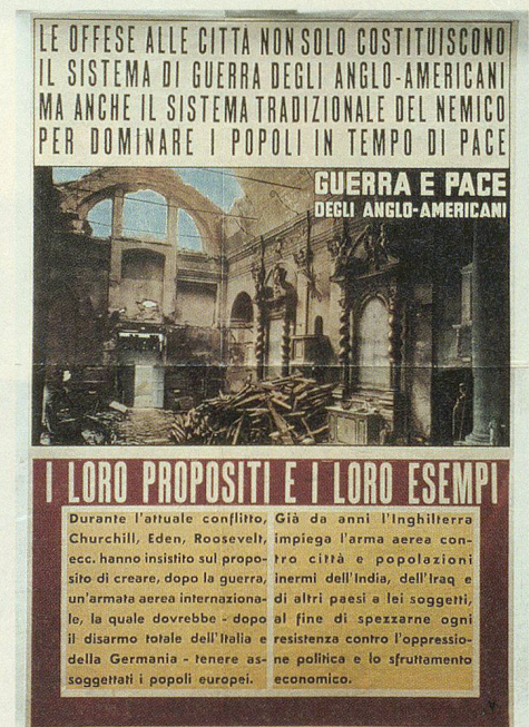
Die Zerstörung von Kirchen als Mittel der Kriegsführung. Gegen die Alliierten gerichtetes Propagandaplakat. Italien, um 1944.

Der im Haager Abkommen geforderte internationale Schutz der Kulturgüter bei bewaffneten Konflikten macht jedoch nur dann