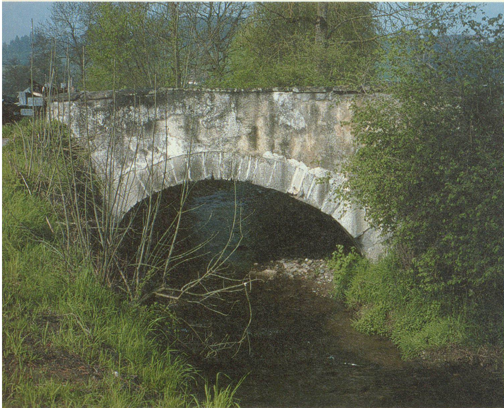
Steinbrücke über den Bielbach bei Ruswil. Die Unterschutzstellung verhindert ihren Abbruch.

DAS RECHT DES MENSCHEN AUF DEN SCHUTZ DES KULTURELLEN ERBES