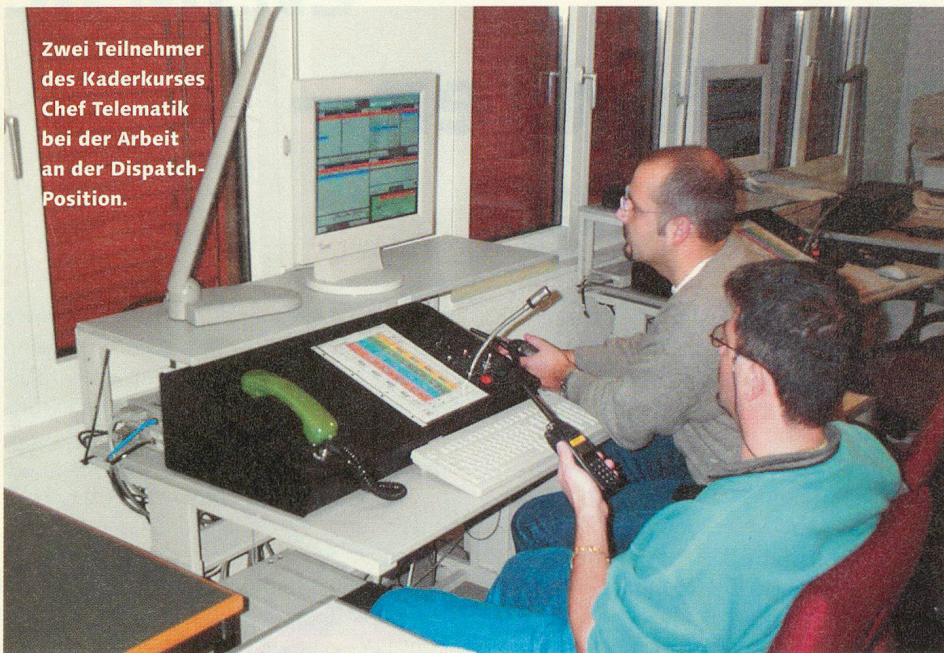
Zwei Teilnehmer des Kaderkurses Chef Telematik bei der Arbeit an der Dispatch-Position.