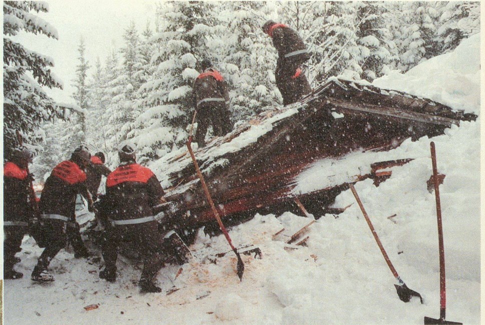
Beim Freilegen eines durch eine Lawine verschütteten Stalles.

Jeder Mensch erklimmt irgendeinmal die letzten Sprossen der Karriereleiter. Für die