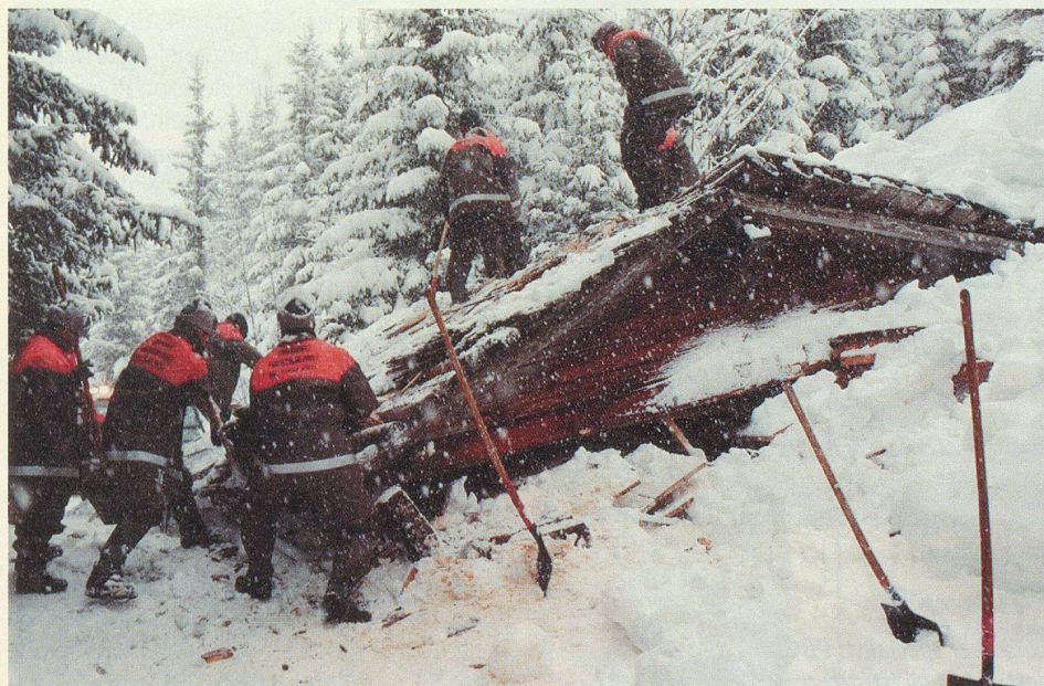
Membres de la protection civile en train de dégager une étable ensevelie sous une avalanche.

Je tentai donc ma chance et le nouveau venu fit si bien ses preuves en tant que «télématicien» que le chef de la télématique d'alors proposa ma candidature pour participer à un cours de formation à la fonction de chef de groupe télématique.