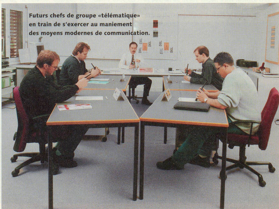
Futurs chefs de groupe «télématique» en train de s'exercer au maniement des moyens modernes de communication.