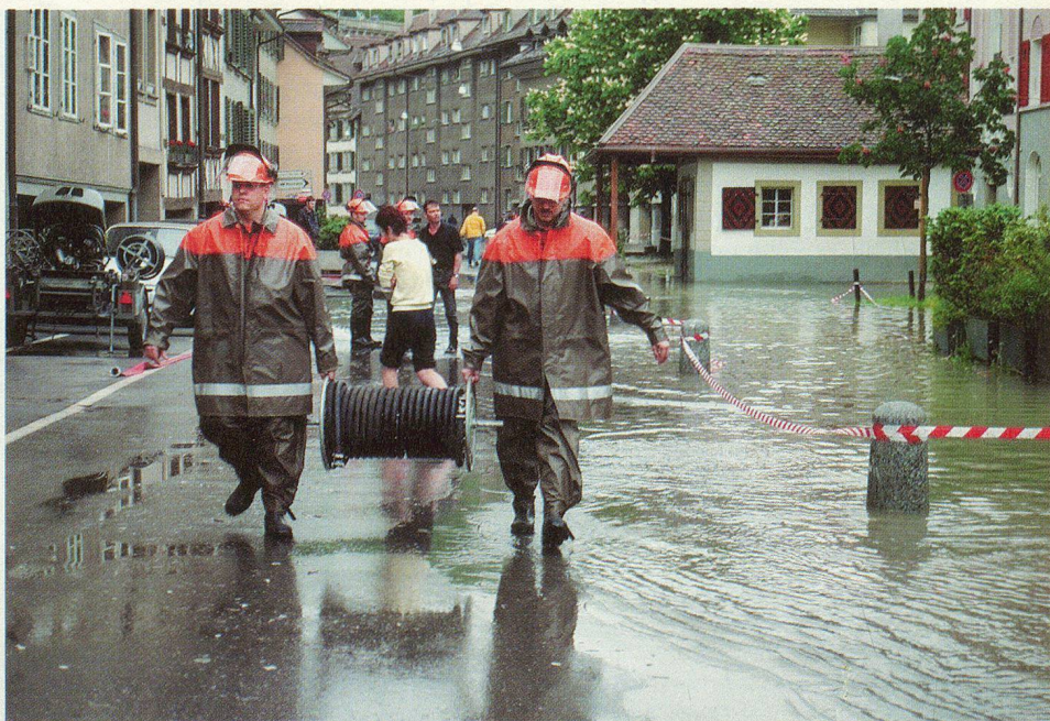
Membres de la protection civile en intervention dans le quartier «Matte» de la ville de Berne, inondé par les eaux de l'Aar.