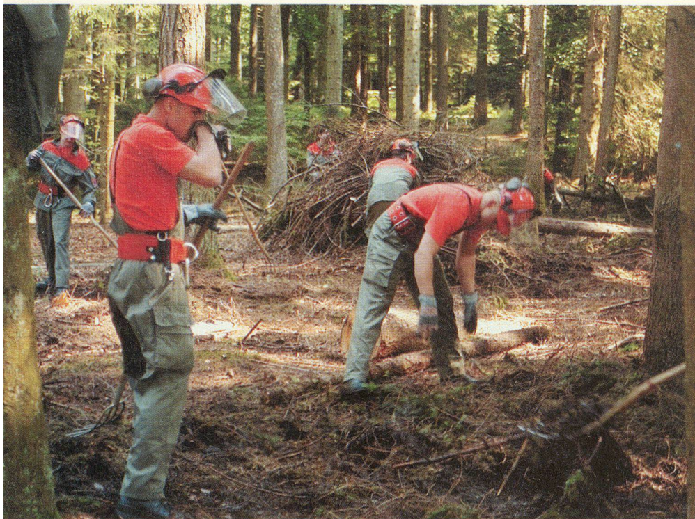
Membres de la protection civile en train de nettoyer une forêt suite à une tempête.

La participation à ce cours supposait de bonnes connaissances et une solide expérience en tant que collaborateur d'état-major. Ce cours de perfectionnement consista non seulement à acquérir de nouvelles connaissances et aptitudes techniques, mais aussi à me préparer à assumer la responsabilité des hommes et du matériel dans le domaine de la télématique dans le cadre d'engagements.