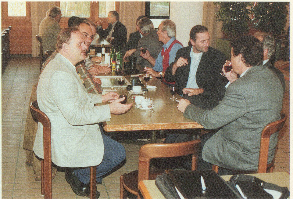
Angeregte Diskussion vor und nach dem Mittagessen:

Und – nochmals das liebe Geld: zeitweise sei er sich wie in einem Finanzseminar vorgekommen. Dabei sei es eigentlich weniger wichtig, woher das Geld komme. Es müsse nur soviel sein, dass der Zivilschutz sicher operieren und seine Aufgaben erfüllen könne. Ob das Material via Bund oder durch eine andere zentrale Stelle kostengerecht und einheitlich eingekauft werde, sei dabei weniger entscheidend. Von den Politikern forderte Bucher Klarheit in der Zielsetzung und kein Spiel mit verdeckten Karten. □