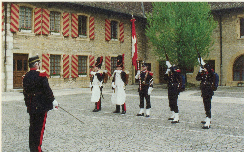
La guardia d'onore mentre spara una salva di saluto.