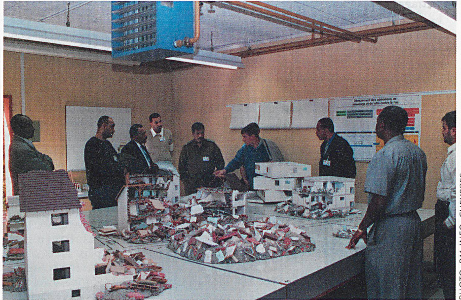
Devant la maquette des décombres.

Depuis de nombreuses années, l'Office fédéral de la protection civile offre des cours de chef OPC en particulier. Ceci a permis de faire connaître notre système à de nombreux pays d'Afrique surtout. Ces cours sont organisés en partenariat avec l'Organisation internationale de la protection civile (OIPC) et la Direction pour le développement et la collaboration (DDC). Une bonne partie des cours ont lieu en Suisse, au Centre d'instruction de la ville de Genève.